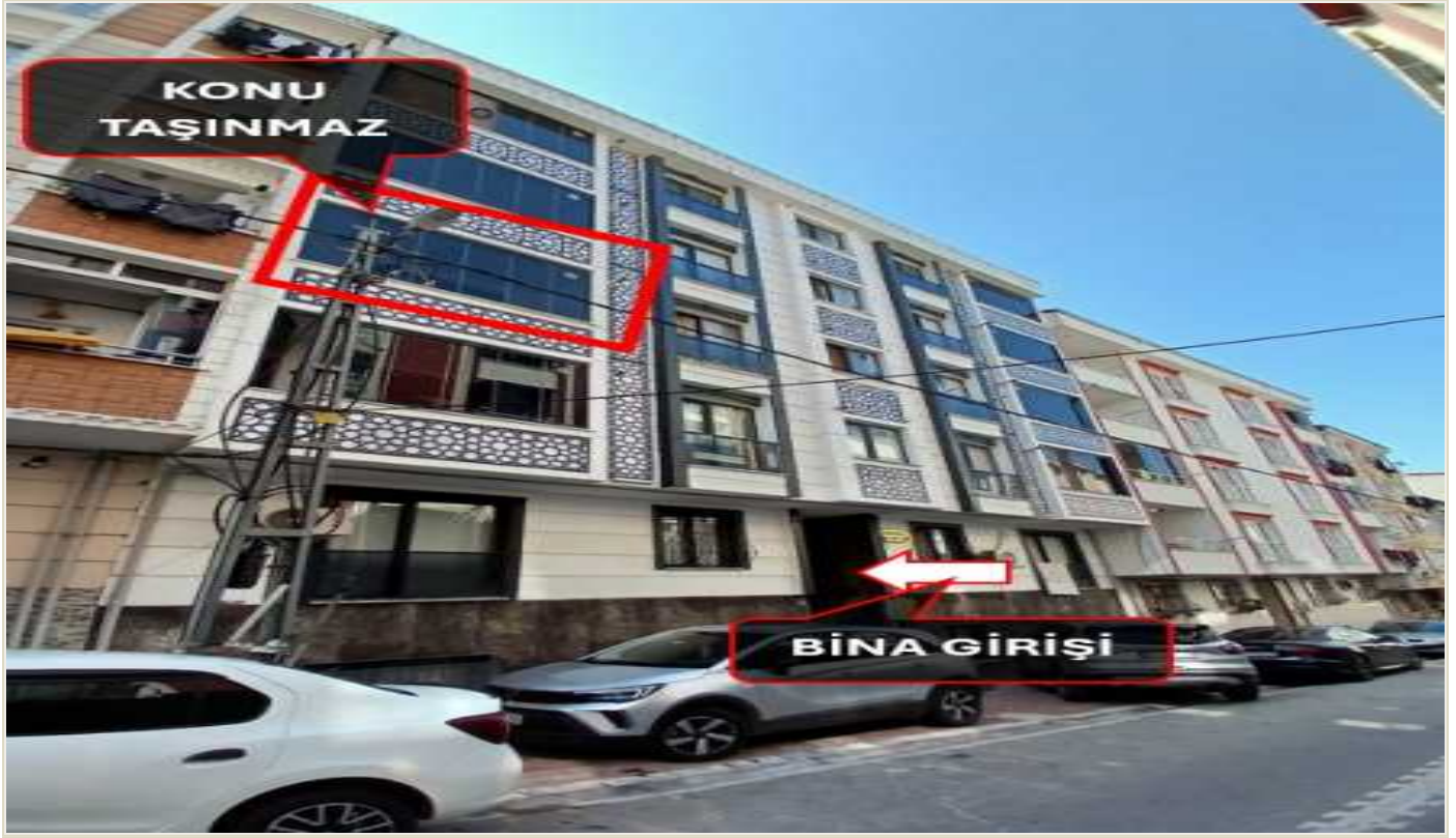
Kat İrtifakına Esas Değerleme Tablosu